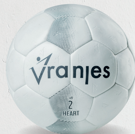
7202515 cool grey